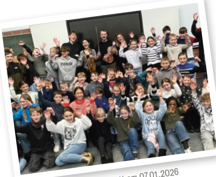
Das Confringo Klavierquartett am 07.01.2026 im Wirtschaftswissenschaftlichen Gymnasium