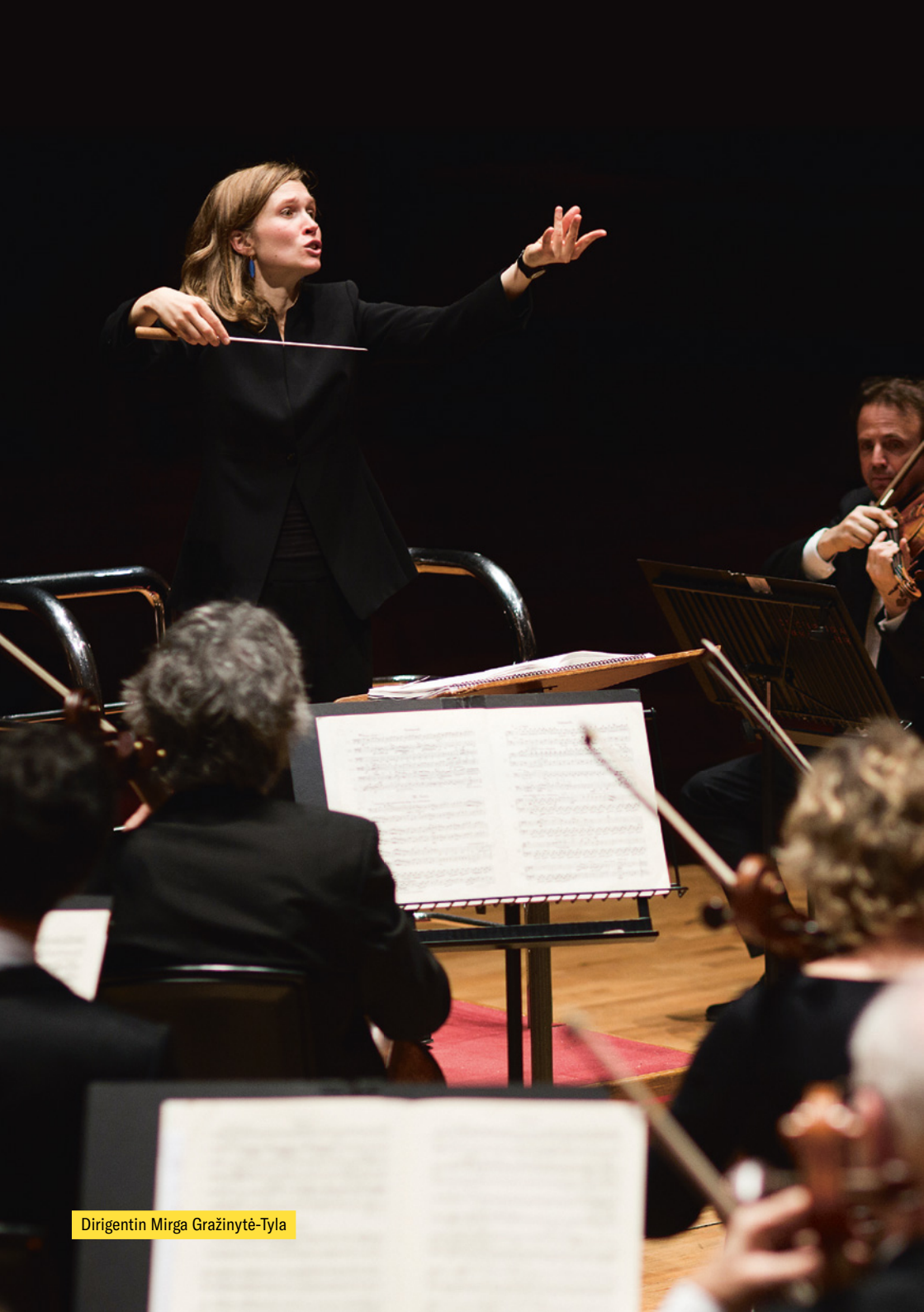
Dirigentin Mirga Gražinytė-Tyla